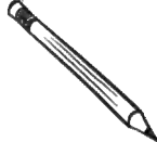
crayon à mine